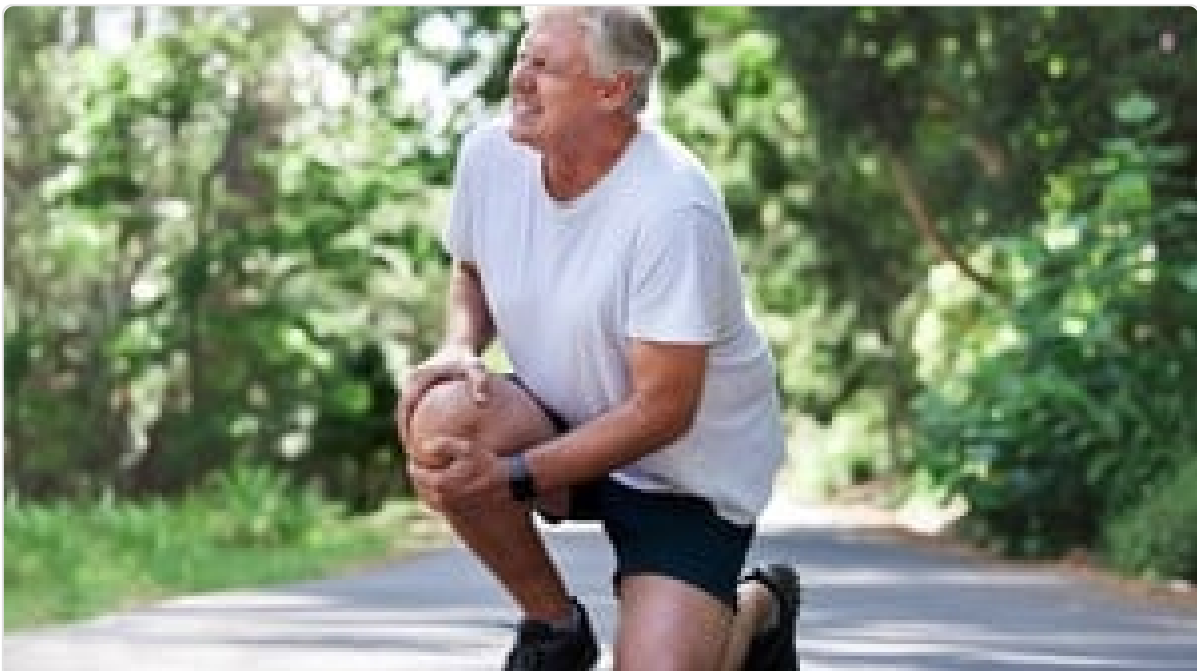
Artritis: por qué duelen las rodillas y la cadera y cómo cuidar las articulaciones a partir de los 50, según un experto