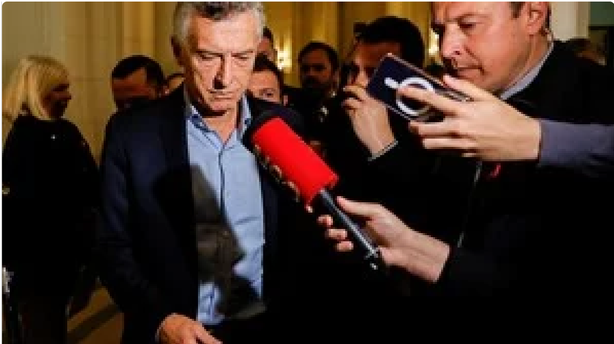
Mauricio Macri dijo que Javier Milei es "el único camino que tiene la Argentina hoy" y acusó al radicalismo de "transar" con Massa