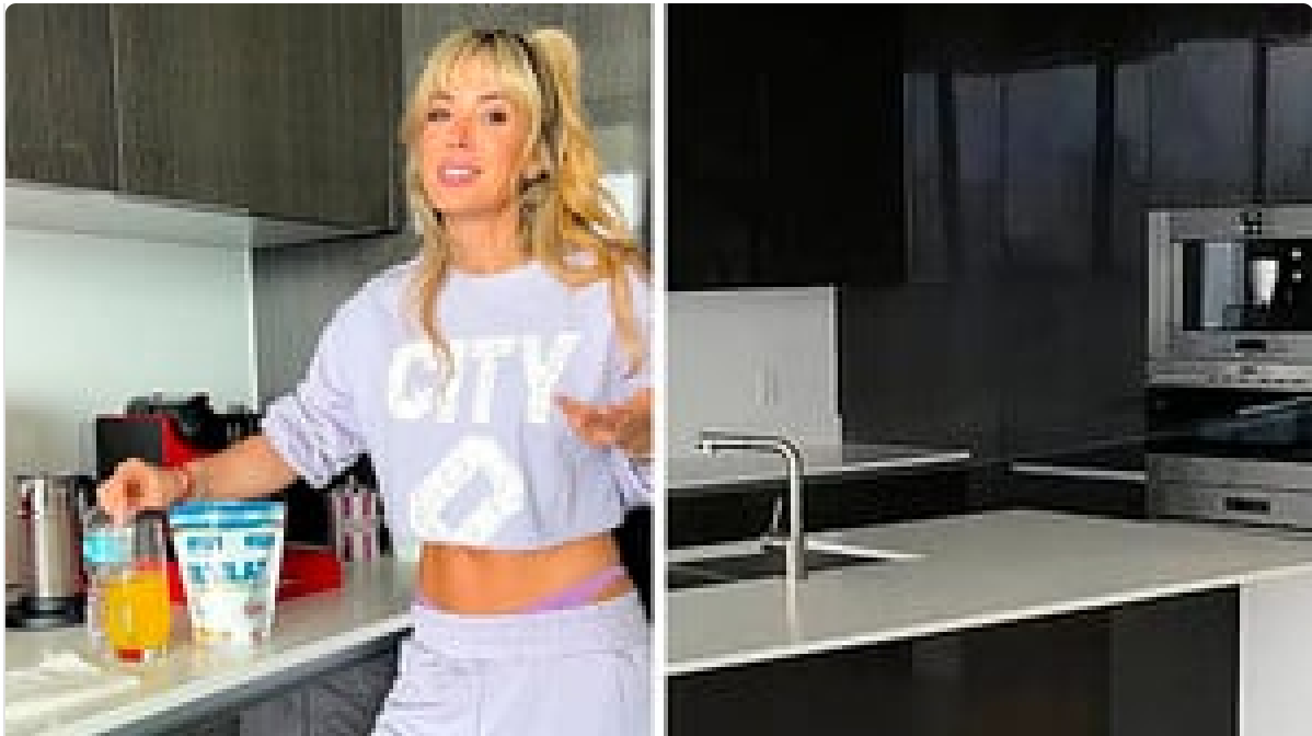
Yategate: la Justicia pidió a EE.UU. que confirme si un departamento de US$ 1.700.000 pertenece a Martín Insaurralde y Jesica Cirio