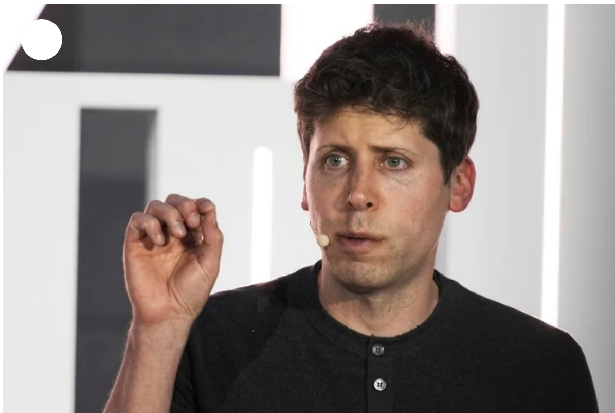
Sam Altman, CEO de OpenAI, nuevo referente de Silicon Valley.

Al igual que tantas otras tecnologías nuevas, Worldcoin suscita innumerables debates . Algunos critican la idea de intercambiar datos personales por criptomonedas, mientras que otros cuestionan la viabilidad de una solución de este tipo para los problemas que la IA plantea en la órbita de la fuerza laboral. Al parecer, el trabajo ya no dignifica .