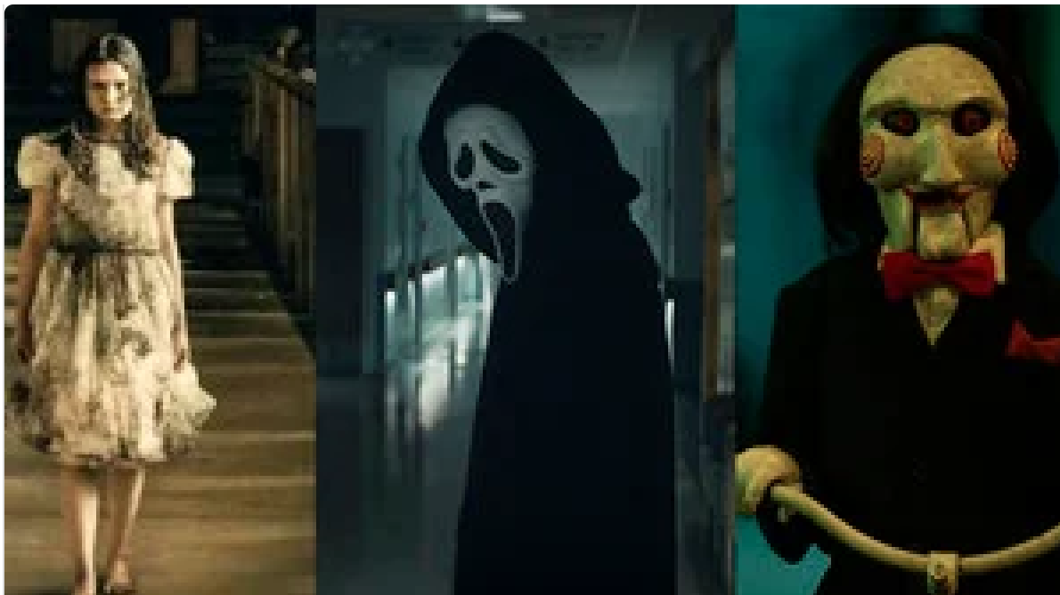
Las nuevas películas de terror más espeluznantes para ver este Halloween