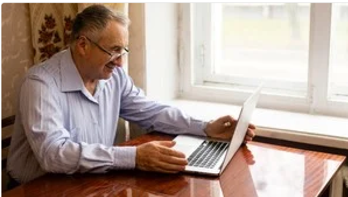
Cómo seguir trabajando después de jubilarse: qué trámite hay que hacer y qué aportes se pagan