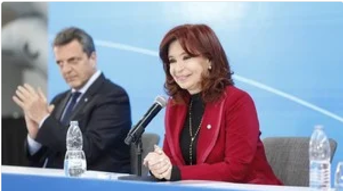
Massa vs. Milei: la encuesta que le llegó a Cristina con números para el balotaje