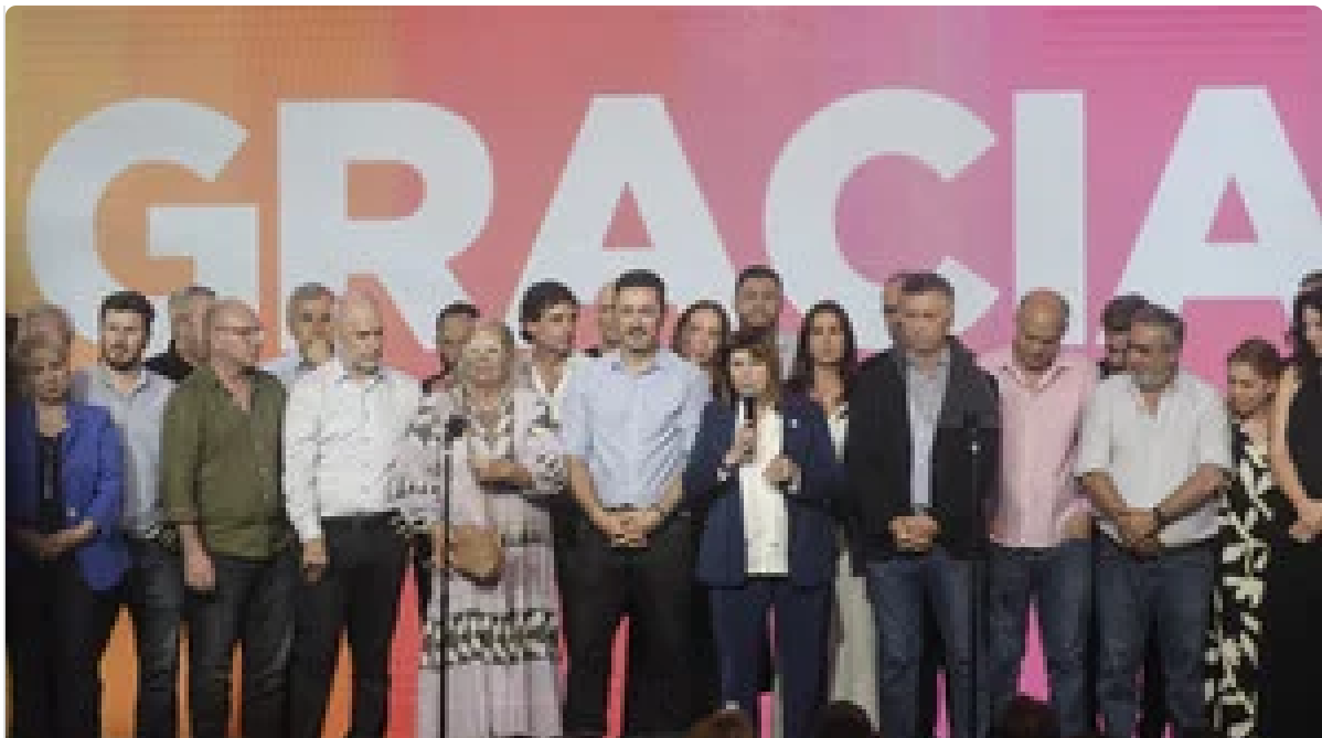
Mauricio Macri cargó con dureza contra tres dirigentes radicales y reveló qué pasó con Morales la noche de las elecciones