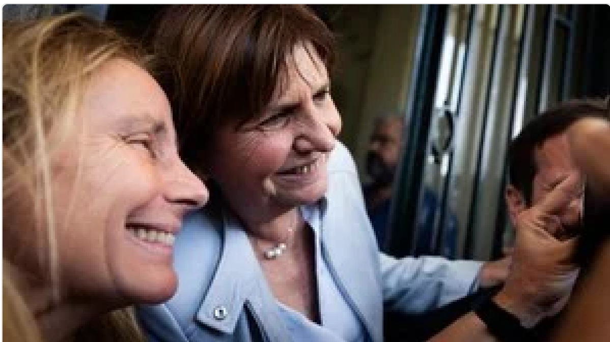
Nueva encuesta para el balotaje y un dato clave: cómo se reparten los votos de Patricia Bullrich